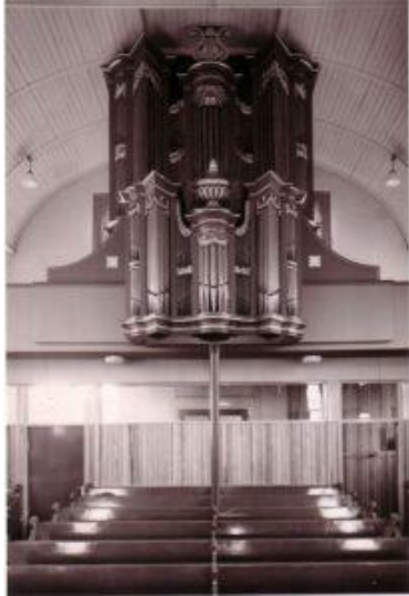
Het orgel van 1954.

Veel was in de eerste honderd jaar gebeurd; teveel om hier allemaal te beschrijven. Een anekdote die misschien verdient verteld te worden gaat over de orgeltrapper. Het orgel dat de kerk rijk was kende geen windmotor maar wel een ‘broeder-orgeltrapper’, die – om lucht in de blaasbalg te pompen – zich in het zweet zijns aanschijns moest werken door staande op twee trapbalken deze op en neer te bewegen. Zwaar werk! Al in 1884 werd aan de orgeltrapper als vergoeding voor zijn diensten een cadeau gegeven, bestaande uit... een broek, een vest en een kiel.