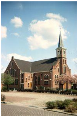
De gereformeerde kerk te Siddeburen.

Ook na de oorlog werd gebouwd, maar om een minder prettige reden. Het kerkgebouw had namelijk bij de bevrijding van Siddeburen in 1945 ernstige schade opgelopen. Vanuit Hellum schoot een zeventigtal Canadese kanonnen hun keiharde kogels richting van Delfzijl. De Duitsers schoten vanuit die Groningse havenstad terug, maar het bereik van hun artillerie was te gering, zodat de meeste Duitse granaten in en in de omgeving van Siddeburen terecht kwamen. Ook de kerk kreeg hiervan haar deel: drie voltreffers die het gebouw onbruikbaar maakten voor het houden van kerkdiensten.