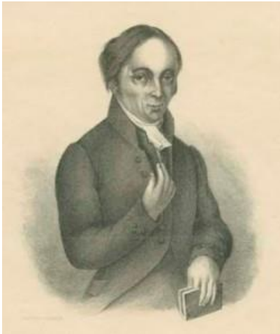
Ds. H. de Cock (1801-1842).

Maar in 1834 hoorden de bezoekers van deze gezelschappen wat zich in Ulrum had afgespeeld, waar ‘de Waarheid minnende ds. H. de Cock (1801-1842) ’ was afgezet als hervormd predikant. Vanaf dat ogenblik ging men meermalen op zondag lopend naar Ulrum, een afstand van ongeveer veertig kilometer, om daar naar de veel bespotten Afscheiden dominee De Cock te luisteren. Op zaterdagavond vertrok men en zondagmorgen kwam men in Ulrum aan. Nadat er tweemaal gekerkt was, en tussendoor de meegebrachte boterham was opgegeten, sprak men vaak langdurig met ds. De Cock en ging men daarna weer terug, zodat men ongeveer te middernacht weer in Hellum en Siddeburen aankwam.