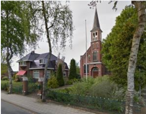
De gereformeerde kerk en de pastorie van 1928 te Siddeburen.

In 1928 werd besloten tot de bouw van een nieuwe pastorie, zodat ds. Los, toen hij in de strenge winter van 1928/1929 in Siddeburen aankwam, meteen in een nieuwe pastorie kon trekken. Verder kwam in 1936 het gebouw 'Rehoboth' achter de kerk tot stand.